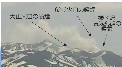
北西側から見た火口周辺の状況

62・2火口付近に設置された前十勝西の傾斜計では、微動や地震増加と同期した傾斜変動は観測されていません。GNSS連続観測では、山体浅部の膨張を示す地殻変動は2017年秋ころに停滞し、現在も膨張状態を維持しています。より深部の動きを示す、基線長の変化は認められません。