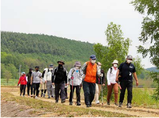
作品の世界を振り返りながら進む参加者