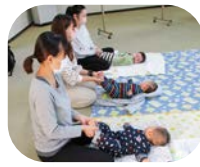
ふれ愛マッサージ