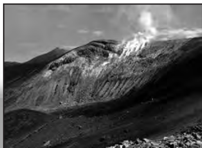
十勝岳 大正火口東壁の状況