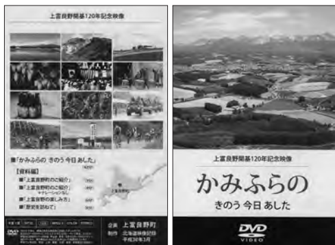
「かみふ」が詰まった、 全61分のDVD