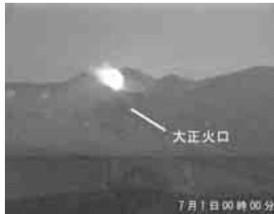
国土交通省北海道開発局 望岳台カメラ

火口周辺に影響を及ぼす噴火の兆候は認められませんが、大正火口や62・2火口付近には近づかないよう注意してください。十勝岳では2006年からみられている62・2火口直下浅部の膨張を示す地殻変動は現在も続いていますので、火山活動の推移に注意してください。平成20年12月16日に噴火予報（噴火警戒レベル1、平常）を発表しました。その後、予報警報事項に変更はありません。