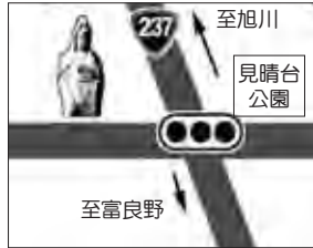
道道留辺藪上富良野線と 国道237号線との交差点 (観音像前)