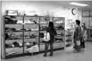
リサイクルコーナーでは、みんな真剣(?)に品定め

家庭で不要になったマタニティ・育児用品などを提供していただき、必要な方へ無償でお渡しします。 (ベビーカー、ベビーベッド、チャイルドシート、衣類など)