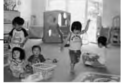
「なかよしサロン」は親も子どももみんな仲良くなれる場所～♪

曜日 月曜日～金曜日 (祝日除く) 時間 9:00～12:00 13:00～16:30