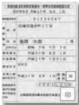
色はオレンジです

◆減額認定証が新しくなります 現在ご使用の減額認定証(限度額適用・標準負担額減額認定証)は、有効期限が7月31日までとなっており、8月以降は使用できなくなります。 8月以降も認定証が必要な方は、次の交付要件に該当することを確認し、印鑑を持参のうえ、左記へ申請してください。