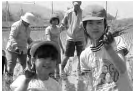
田植え体験での一コマ。みんないい笑顔です。

●保護者の方からは:「三人兄妹の一番下の子が今年入学しました。甘やかして育ててしまったので、心配でしたが、小さい学校ならではの優しさがあり、毎日楽しそうです」との感想が。