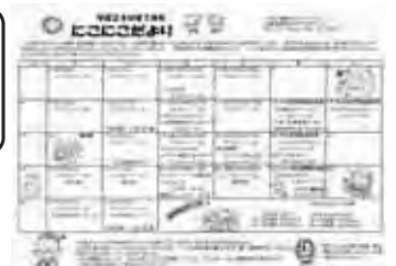
情報満載の「にこにこだより」