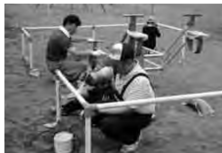
6月24日 商工会青年部による環境整備活動