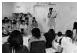
「よちよち」での1コマ

問合せ 子育て支援センター「にこにこ」 大町3丁目2番22号 子どもセンター内 (町立病院となり) ☎6501