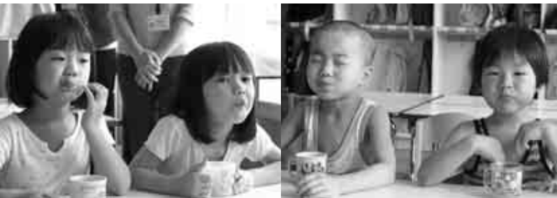
5月10日、西保育園での第1回目のうがいの様子。1回分5mlを、歯の隅々まで行き渡らせるため1分間、うがいというよりも口の中でブクブクする。みんな上手にできましたー(〇〇)/ 広報担当も試しにブクブクしてみましたが、液は無味無臭でした。

乳歯から永久歯に生え変わり始めるタイミングで開始して、最後の永久歯が生えて2〜3年後まで継続する必要があり、一定期間継続すれば大人になってもその効果は持続するとの報告があります。