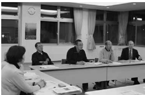
【協働のまちづくり推進委員会】