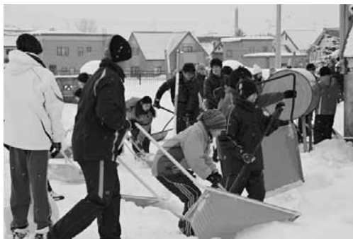
【除雪ボランティア】