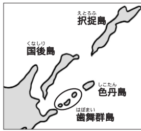
北方四島(色丹島、択捉島、国後島、歯舞群島)