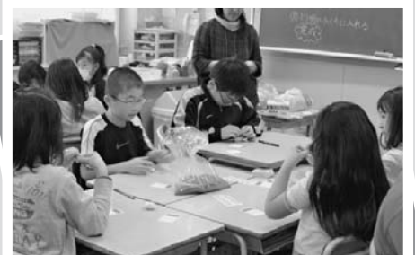
12月13日まちの観光を知ろう・ラベンダーポプリ香り袋製作(上富良野西小学校)