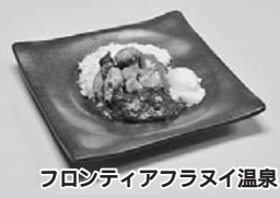
フロシディアフラヌイ温泉