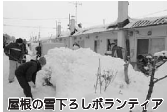
屋根の雪下ろしボランティア

当町では、ボランティアセンター(町社会福祉協議会内)が高齢者を対象に屋根の雪下ろしボランティアを例年実施しており、いくつかの企業が参加しています。