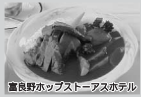
富良野ホップストアホテル