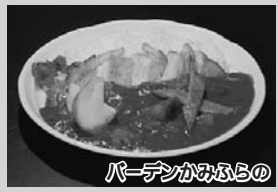
バーデンかみふるの