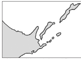
えとろふ くのしり しこたん はほまい 択捉・国後・色丹・歯舞は日本の領土です