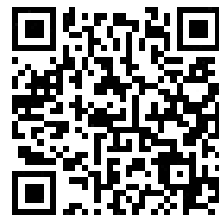
町民ポスト電子版 QRコード