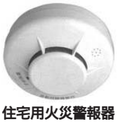
住宅用火災警報器