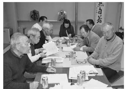
西富住民会福祉マップ作成

社会福祉協議会が、運営の指導を行い、町は、活動費を補助しています。この活動は、他の住民会のモデルとして波及していくことが期待されています。