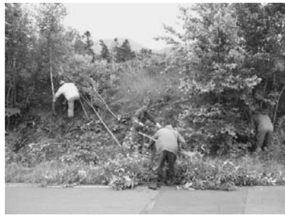
島津住民会樹木伐採作業

日の出住民会では、道路の環境整備に取り組み、傾斜地の下に不法投棄された家電品を引き上げたり、空き瓶、空き缶を拾い、ごみの量は、トラック4台分にもなりました。ごみの最終処分は、町が引き受けました。