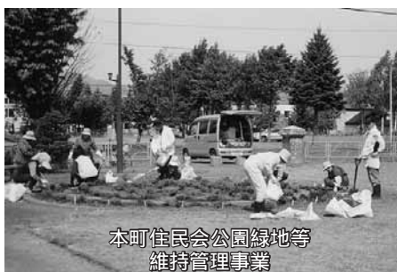
本町住民会公園緑地等 維持管理事業