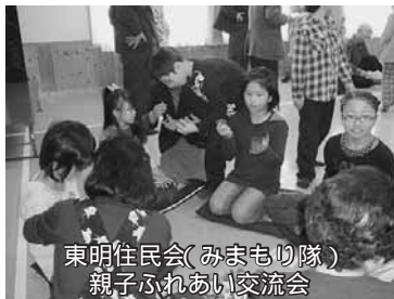
東明住民会(みまもり隊) 親子ふれあい交流会

これらを踏まえたうえで、町民と行政がそれぞれ、 で行うより、 効率的、効果的に事業を行えることがポイントです。 町民が関わることで、行政では考えも