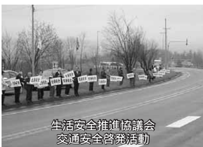
生活安全推進協議会 交通安全啓発活動