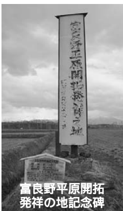
富良野平原開拓発祥の地記念碑