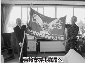
直接支援小隊長へ