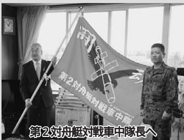
第2対舟艇対戦車中隊長へ

4月22日に、上富良野駐屯地に第2対舟艇対戦車中隊と直接支援小隊が配備されました。隊員はおよそ100名です。自衛隊協力会から応援旗が、それぞれ中隊長と小隊長に手渡されました。