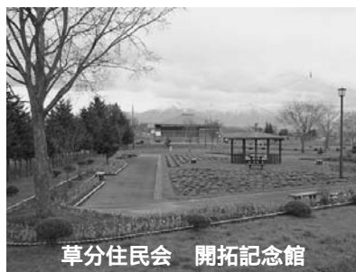
草分住民会 開拓記念館

「地域住民12、13名が1日交代で担当しています。お客さんがいないときは、草刈り、草取り、芝刈り、ごみ拾いなど屋外の管理をします。担当者の中には、開拓以来の三重団体の子孫もおり、地域の住民として噴火のことや泥流災害のことなど、できる限り説明をさせていただき、喜ばれています。」