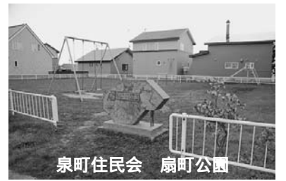
泉町住民会 扇町公園

維持管理が今後、心配です。住民会としては、これ以上の面積の管理は難しいと思っています。」