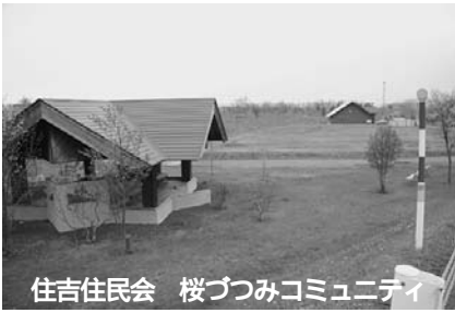
住吉住民会 桜づつみコミュニティ

「何か事故があつたら困るので、損害保険に加入していますが、記名式の保険で、作業に参加する可能性がある方みんなを加入したところ、予算をオーバーしてしまいました。作業をみんなですることにより、意思の疎通が図られ、別に実施した道路清掃のときは、80人もの皆さんに参加いただきまし