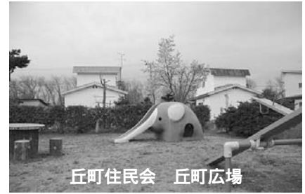
丘町住民会 丘町広場

ど生えてこないよう草刈りではなく、根から抜きました。30人以上の人が集まって作業をしました。また、公園の外灯をLEDにしてもらうよう要望しています。」