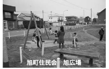
旭町住民会 旭広場