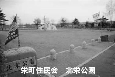
栄町住民会 北栄公園

「一人の方をお願いして草が伸び次第草刈りをしてもらっています。トイレは今年から管理をしていきます。他に地域を流れているコルコニウシベツ川の草刈りなどを行っています。」