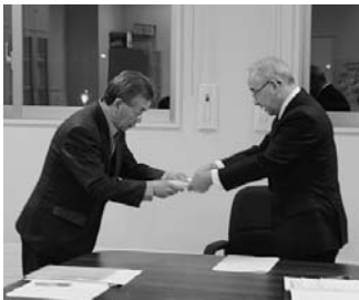
協働のまちづくり基本指針を 推進委員会会長から町長へ

「協働のまちづくり基本指針」を町長に提出し、その後、「協働のまちづくり概要版」について協議しました。