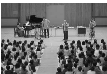
音楽鑑賞<小学生の部>

町内の各小学校、幼稚園、各保育園、 保育所が実行委員となり、芸術文化普 及のため音楽や演劇など芸術観賞の機 会を提供しています。小学生、幼児を 対象に町民芸術劇場を開催していま す。