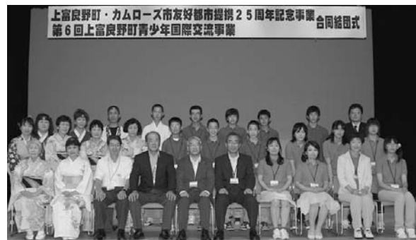
カムローズ市友好都市提携25周年記念事業 第6回青少年国際交流事業合同結団式