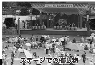
ステージでの催し物

す。会場では、ココア、ホットミルク、綿あめがふるまわれ、打上げ花火が行われます。 北の大文字運営委員会は、商工会青年部、JAふらの青年部上富良野支部、リフレッシュマイタウンかみふらの、青少年団体協議会、自治労上富良野町職員組合、役場陸上部で構成されています。