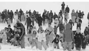
ゲームに参加する子どもたち

かみふらの雪まつり運営委員会は、上富良野町、かみふらの十勝岳観光協会、商工会、ふらの農業協同組合上富良野支所、上富良野駐屯地、建設業協会、女性連絡協議会、富良野地方自衛隊協力会上富良野支部女性部で構成されています。