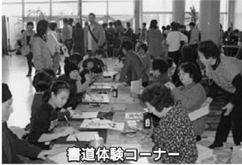
書道体験コーナー