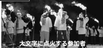
大文字に点火する参加者