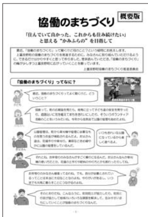
【協働のまちづくり概要版】