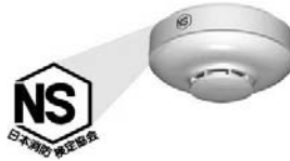
住宅用火災警報器 NSマークのついたものをお勧めします。