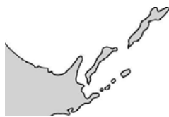
北方四島(色丹島、択捉島、国後島、歯舞島)