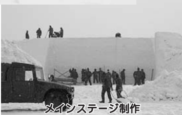
スノーマシンステージ制作