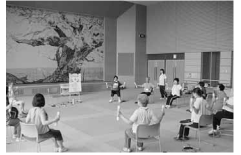
お元氣かいの様子