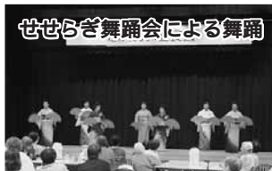
せせらぎ舞踊会による舞踊