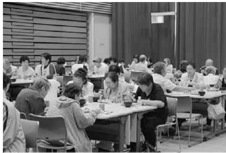
ふれあい昼食会(9月16日実施)

今回は、あゆみ会が調理を担当しま した。前日に食品の買い物や下ごしら えを行い、当日は9人で調理し、110食 を用意しました。昼食前に生活安全推 進協議会と上富良野交番が協力してオ レオレ詐欺防止の寸劇を行い、昼食後