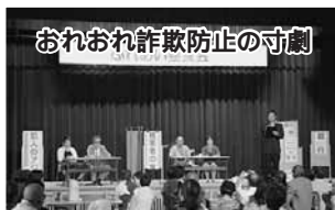
おれおれ詐欺防止の寸劇