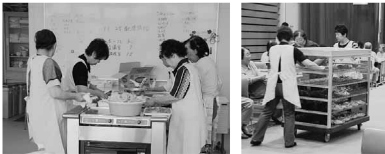
あゆみ会(9月16日実施のふれあい昼食会)