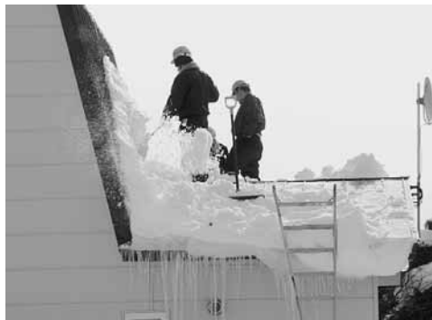
高齢者宅の雪下ろし

町内の団体、自衛隊駐屯地修親会・曹友会、上富良野高等学校、上富良野中学校生徒会、青少年団体協議会、サツポロビール株式会社、テクノス北海道株式会社、アラタ工業、西塚清掃社、2戦車OBボランティアクラブが独居高齢者宅の屋根の雪下ろしや除雪を行っています。