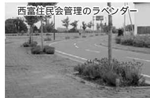
西富住民会管理のラベンダー

5月26日に、35名で公民館前のロータリーの花壇から道道までの区間のラベンダーが植えてある植樹枡の草取りなどを行いました。