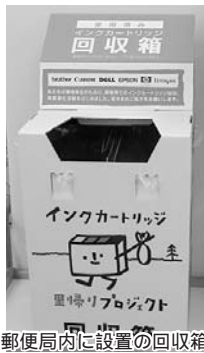
郵便局内に設置の回収箱

パソコンメーカーと日本郵政グループが共同で家庭用の使用済みカートリッジを資源として回収しています。上富良野郵便局に回収箱が設置してありますのでご利用ください。