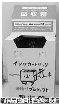
郵便局内に設置の回収箱

パソコンメーカーと日本郵政グループが共同で家庭用の使用済みカートリッジを資源として回収しています。上富良野郵便局に回収箱が設置してありますのでご利用ください。