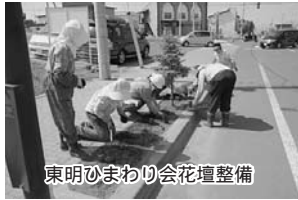
東明ひまわり会花壇整備

野振興公社から花の苗およそ800本と石灰や肥料などの資材を提供いただき、今回は17名が参加して行いました。今年で8年目を迎えますが、「協働のまちづくり」として、今後も続けて行き