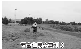
西富住民会草刈り

7月2日～9日の間、5名が交代で、富良野川の堤防7千370㎡の草刈りを実施しました。