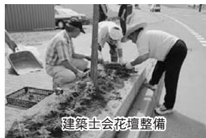
建築士会花壇整備

北海道建築士会上富良野支部では、20年以上前から、町内の清掃と美化活動に取り組んでいます。