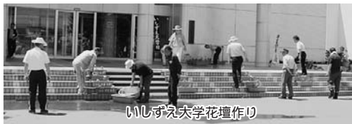
いしずえ大学花壇作り

いしずえ大学の学生が学習日に合わせてボランティア活動の一環として、プラントナーに花を植えて飾ります。今年は6月11日に花植えを行い、社会教育総合センターと公民館の前に飾りました。