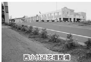
西小付近花壇整備

西小学校付近の教住町内会に所属する、花の好きな方たちが、春先に西小付近の沿道に花壇の整備を実施しました。