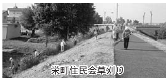
栄町住民会草刈り

6月20日に、33名がコルコニウシベツ川の堤防5千40㎡の草刈りを実施しました。