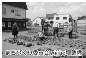
まちづくり委員会駅前花壇整備

上富良野町都市計画マスタープランの策定時に町民10名で結成されたまちづくり委員会では、人々が気持ちよく訪れられるようにと、6月10日に駅前花壇を整備しました。