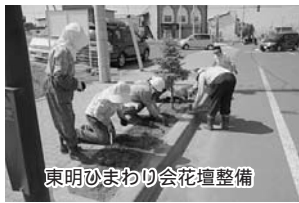
東明ひまわり会花壇整備

野振興公社から花の苗およそ800本と石灰や肥料などの資材を提供いただき、今回は17名が参加して行いました。今年で8年目を迎えますが、「協働のまちづくり」として、今後も続けて行き