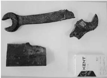
混入していたスパナ

生ごみは、環境衛生センター(富良野広域連合)で処理されていますが、搬入された「生ごみ」から金属類(スパナ)が見つかりました。