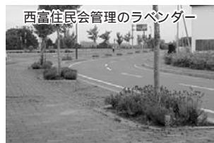
西富住民会管理のラベンダー

5月26日に、35名で公民館前のロータリーの花壇から道道までの区間のラベンダーが植えてある植樹枡の草取りなどを行いました。