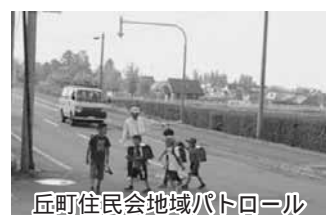
丘町住民会地域パトロール