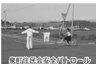
泉町住民会安全パトロール