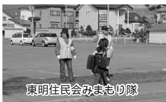
東明住民会みまもり隊

また、車両による巡回パトロールの実施や、これに合わせて独居老人への声かけ訪問を行っています。