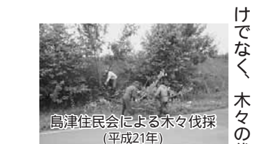
島津住民会による木々伐採(平成21年)

ループに分かれて、地域の方々の協力や理解を得て野球ができることの感謝を込め、町内市街地のゴミを拾いました。約2時間半かけて拾ったゴミは約630kgになりました。