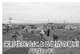
栄町住民会による堤防の草刈(平成20年)

北海道と地域住民が協働して実施する「市民団体草刈ボランティア事業」に、平成19年には中町、栄町、西富の4住民会、平成20・21年度には中町、栄町、西富の3住民会が協力して、河川の堤防周辺の草刈を実施しています。