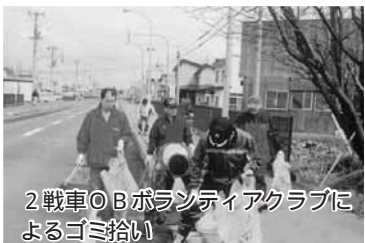
2戦車OBボランティアクラブによるゴミ拾い

4月24日に、会員21名が参加し、中学校から駐屯地東門と駐屯地周辺のゴミ拾いを実施しました。