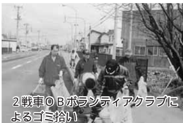
2戦車OBボランティアクラブによるゴミ拾い

4月24日に、会員21名が参加し、中学校から駐屯地東門と駐屯地周辺のゴミ拾いを実施しました。 集めたゴミは軽トラック一台分になりました。 2戦車OBボランティアクラブは、地域社会のためにボランティア活動を行うことを目的に設立されました。