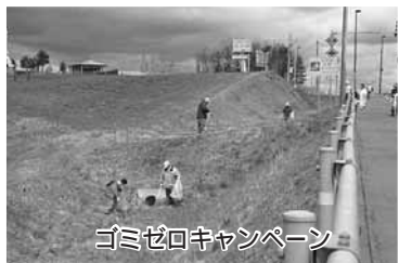
ゴミゼロキャンペーン