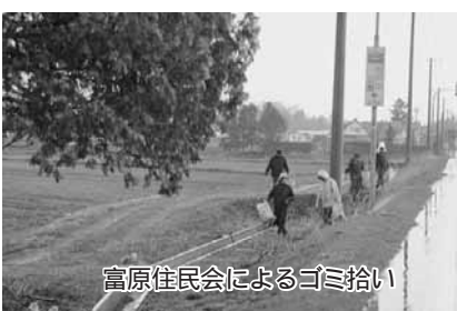
富原住民会によるゴミ拾い

富原住民会では、春に子ども会、老人会と一緒に道路のゴミ拾いをしています。今年は5月1日に、45名が参加して富原地区の東3線、東4線道路、