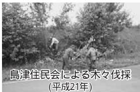
島津住民会による木々伐採(平成21年)

昨年、島津住民会では、ゴミ拾いだけでなく、木々の伐採・処分を行いました。 ラベンダーハイツ前の道路に伸びていた木々を、4名の会員で伐採しました。