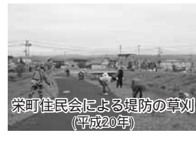
栄町住民会による堤防の草刈(平成20年)

河川堤防等の草刈 北海道と地域住民が協働して実施する「市民団体草刈ボランティア事業」に、平成19年には中町、栄町、西富、丘町の4住民会、平成20・21年度には中町、栄町、西富の3住民会が協力して、河川の堤防周辺の草刈を実施しています。