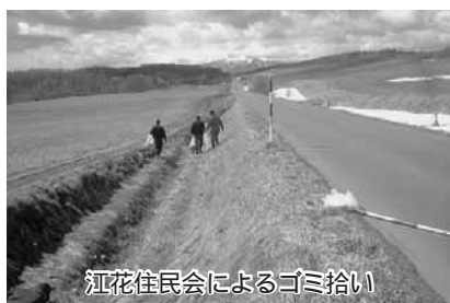
江花住民会によるゴミ拾い

「不法投棄された物を回収できて良かった、今後も続けて行きたい」と話していました。