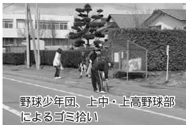
野球少年団、上中・上高野球部によるゴミ拾い