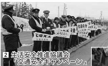
2 生活安全推進協議会「交通安全キャンペーン」