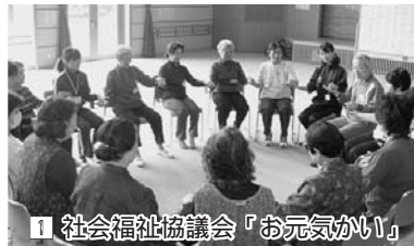
1 社会福祉協議会「お元気がいい」