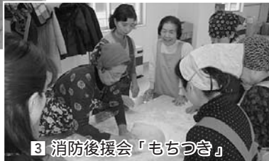
3 消防後援会「もちつき」