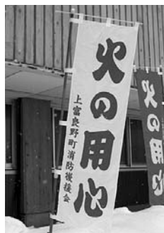
消防後援会作成の啓蒙のぼり

しかし、近年は少子化や団員の高齢化が進み、消防団員のなり手が少ない現状にあります。現在53名(定員55名)ですが、また、日ごろから消防団員を支えてくれる家族にも、親睦などで感謝の気持ちを伝える家族にも、支援しています。 町の防火・防災のためには、町民の皆さんと一緒に消防団を支えていくことが必要です。消防団員の活動をご理解いただき、今後もご協力をお願いします。