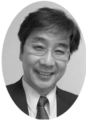
国際ボランティア協会理事、内閣府・大阪府各委員ほか