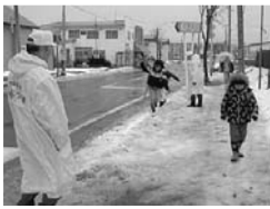
防犯パトロール(旭)