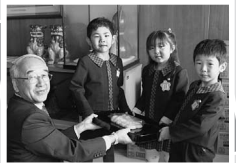
12月10日 おもちゃをつきました(高田幼稚園)