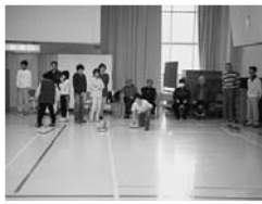
フロアカーリング(本町)