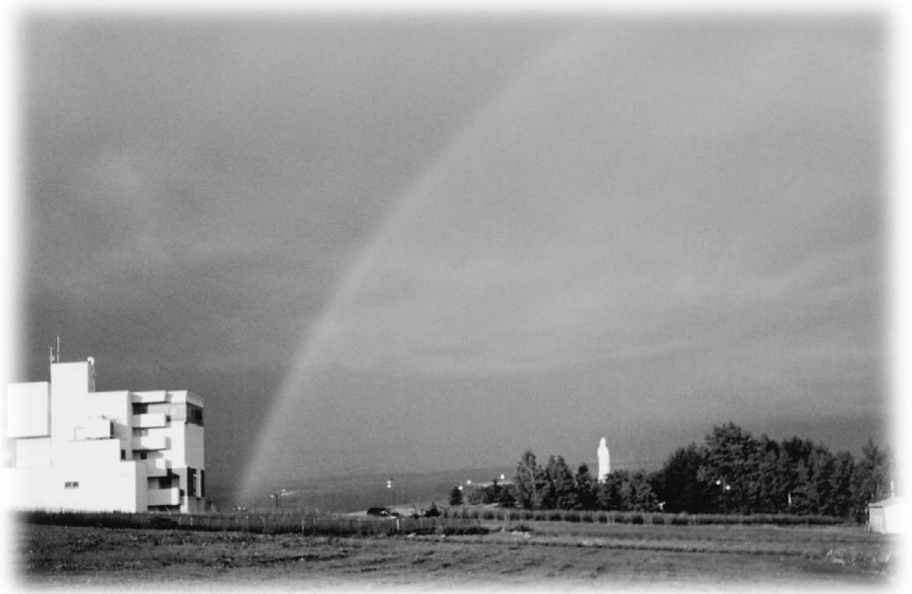
題名『虹の架け橋』 ~ 山品岩夫さん(大町4丁目)の作品