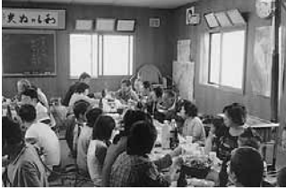
ごみ拾い後の交流会

今年6月、住民会区域内のごみ拾いを行いました。小学生から70代まで48名が参加し、集めたごみは45ℓのごみ袋で25袋になりました。参加者は、ごみの多さに驚くとともに、ひとりひとりが気をつけようという意識を強く持ち、今後も続けていきたいとの声が出ています。