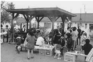
あすなる町内会と合同の夏まつり

春の廃品回収をはじめ、あすなる町内会と合同の夏まつり、夏のお楽しみ会（花火や焼肉）、行灯行列参加、10月の大雪青年の家でのお泊り会、冬のお楽しみ会（スポーツ交流など）など活発に活動しています。