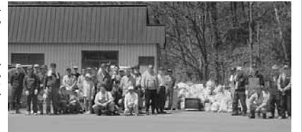
5月に行った清掃活動

約4kmを2時間半かけてきれいにしました。ごみの中には、タイヤや小型冷蔵庫といったものまであり、2tトラックで4〜5台分の量になりました。