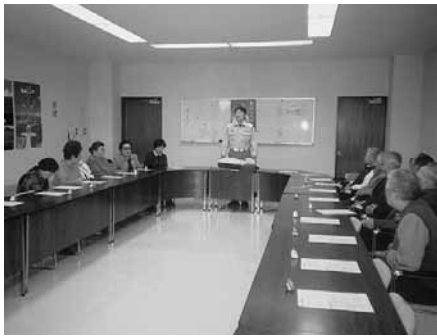
ふれあいサロン「防災研修会」

中町は、町の中心部にあり、旧国道をはさみ商店街が立ち並んでいます。少子高齢化が進んでいますが、子どもは「宝」、子ども会を継続しています。また、高齢者が多くなっていますので、ふれあいサロンや敬老会を重点事業としています。 住民会では、町内会活動に安心して参加いただけるよう、町内会加入世帯すべてが北海道町内会連合会の共済に加入しています。