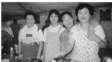
盆踊りに売店を出店