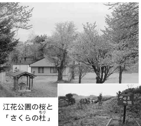
江花公園の桜と「さくらの杜」

江花会館周辺は平成16年の江花開基100年記念で「さくらの杜」として整備し、植樹した100本の桜がようやく開花するようになってきました。桜の木は旧江花小の校歌や校章に用いるなど、