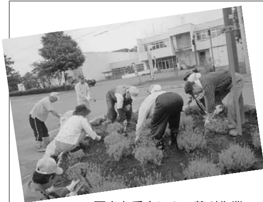
西富友愛会による草刈作業

現在、西富住民会では、住民会福祉ネットワークづくり事業を来年から実施できるよう、準備を進めています。地域の人々がお互いに支えあいながら住み慣れたところで安心して暮らせる地域社会の形成を目的としています。