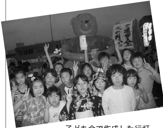
子ども会で作成した行灯

住民会の活動は、地域の範囲が広いことなどから、住民会全体で行う行事より、町内会単位で行う活動が活発と言えます。地域には宮町会館がありませんが、町内会が毎年当番制で、草刈りや掃除などの管理を行っています。