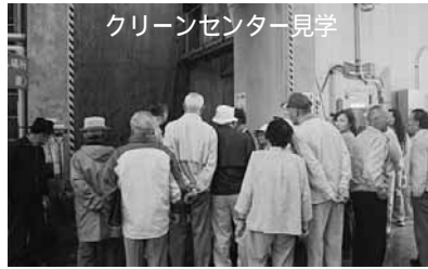
クリーンセンター見学

毎年、ゴールデンウィークには、町内会(ごと)合計約80名参加)で、ごみ拾いなどの清掃活動や子ども会の廃品回収を実施しています。その後には花見を開催し、懇親を図っています。