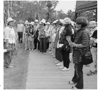
昨年の視察研修の様子