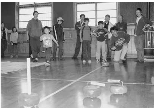
今年の「住民の集い」6月7日開催

この自然と景観に魅せられて、移住される方も増えています。移住される方は、ほとんどが町内会に加入し、行事にも積極的に参加しています。以前は農家が多かったのですが、後継者がいなくなったり、移住されて来た