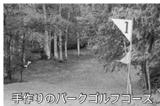
手作りのパークゴルフコース

冬には、会館や体育館などの屋根の雪下ろしを行うほか、大晦日には豊里神社へ初詣に来られる方のための除雪など、地域住民は様々な行事に積極的に参加しています。