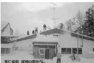
里仁会館 屋根の雪みち