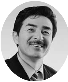
講師 佐藤正久氏 (ヒゲの隊長)