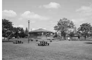
開拓記念館と歴史広場

昨年度から、教育委員会の委託を受けて、開拓記念館の管理を住民会で実施しています。老友会の方々を中心に、管理作業を行うグループを作り実施しています。身近にある施設のため、草刈りや受付など管理面に目が行き届き、来館者にも好評を得ています。