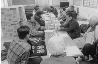
防災訓練について話し合い

十勝岳の泥流災害の危険地域にあることから、住民会独自の防災訓練に対応しています。今年2月の訓練では、実際の災害を想定した避難所の運営を行いました。訓練にあたり役員会などで話し合い、訓練参加への啓発活動を行うなど、住民の防災意識を高めてきています。