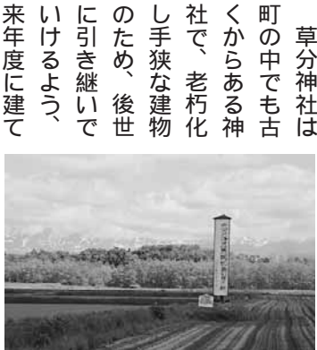
開拓発祥の地と史跡憩の楡

草分は、開拓発祥の地で十勝岳泥流災害から復興したという歴史があり、住民会も活発に活動しています。