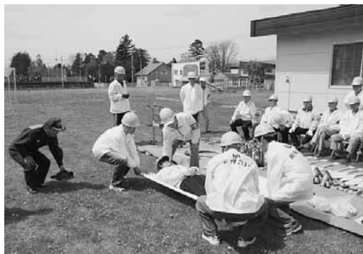
今年5月17日実施の防災訓練

旭住民会は、旭町・新町・東町の1丁目〜3丁目で構成されており、地域には、上富良野中学校・東児童館・わかば愛育園があります。 『元気な高齢者が地域を守る』 旭住民会には高齢者クラブ「旭新あずま会」があり、地域の環境整備や防災、防犯の中心メンバーとして活躍しています。