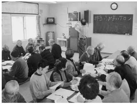
ふれあいサロンの様子

南町住民会の会長は2年任期で、私は務めて2年目になります。 南町住民会は、自衛官の方が多く、現在も増えている状況です。町内会への加入率もほぼ100%となっています。 また、最近が高齢者の世帯も増えており、住民会では、月一度活動している老人会のきらく会(会員37名)の支援のほか、65歳以上の方を対象にした、ふれあいサロン(年3〜4回)やパーク