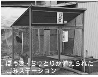
ほうき・ちりとりが備えられたごみステーション

中心に管理することで、きれいな環境が保たれています。ごみステーションの管理は、町内会の大切な活動になっています。