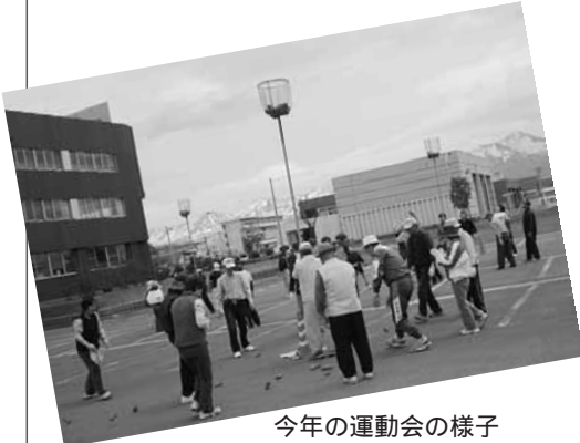
今年の運動会の様子 5月17日 参加者87名

まちをきれいに「積年会」 会員45名 「積年会」は、美しい街並みづくりを目的に、平成12年に設立され、歩道の花壇整備や道路の草刈りなどを行っています。誰でも登録できますが現在ほとんどが65歳以上です。健康づくりのため、月に1回パークゴルフも行っています。