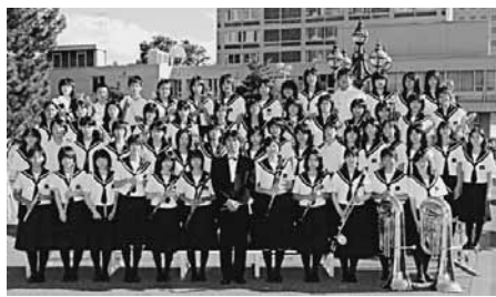
上富良野中学校吹奏楽部

また、上富良野中学校吹奏楽部は、中学校B編成(35名編成)の部で金賞を受賞、10月11日埼玉県所沢市で開催される「第8回東日本中学校吹奏楽大会」の出場権を2年連続で獲得しました。