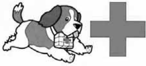
赤十字マーク「白地に赤い十字」