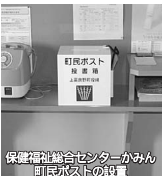
保健福祉総合センターかみん 町民ポストの設置