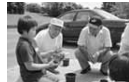
菊の栽培にチャレンジ！

▶「菊の会」のご指導のもと、菊の栽培活動を実施。見事に大輪の花を咲かせ、文化祭に出品しました。