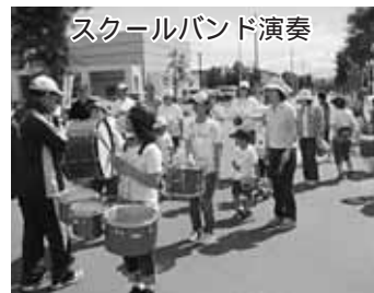
スクールバンド演奏