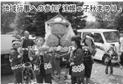
地域行事への参加「江幌っ子秋まつり」