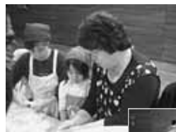
祖父母参観日！ 一緒に昔の遊びを楽しみました。