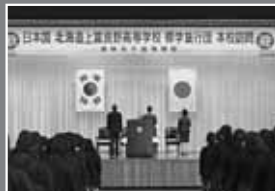
美林女子高校との交流式典