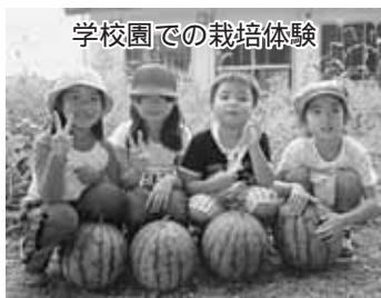
学校園での栽培体験

地域の学校として江幌・静修地区の皆様から支えられ、町から通っている子どもたちも、地域・子ども会行事に積極的に参加し楽しんでいきます。