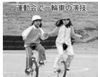
運動会で一輪車の演技