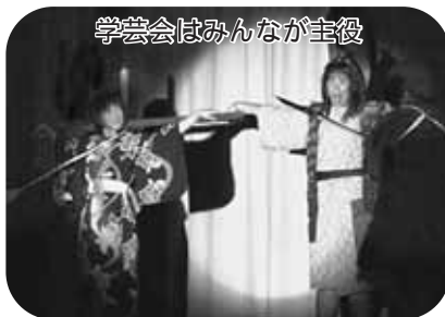
学芸会はみんなが主役