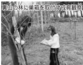
裏山の林に巣箱を取付け成育観察