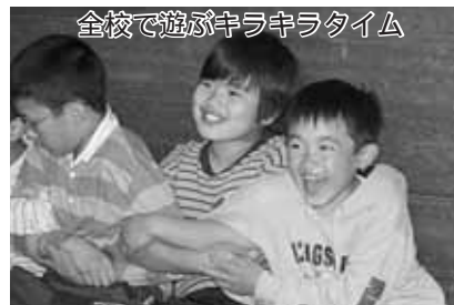
全校で遊ぶキラキラタイム