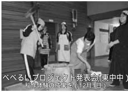
べべるいプロジェクト発表会(東中中) 稲作体験の成果を(12月1日)