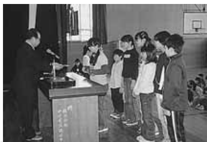
◁12月24日 前期分の表彰 を受賞する西 小学校7名の 児童