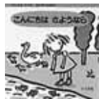
◀9か月~1歳ころ 日常生活を 描いた 絵本