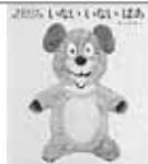
3~6か月ころ◀ リズムカル なことばの 絵本