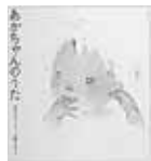
▶0~2か月ころ うたの 絵本