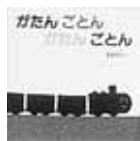
◀2歳から3歳ころ 乗り物の 絵本