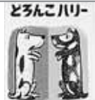
3歳から4歳ころ◀ ストーリーを 楽しむ 絵本