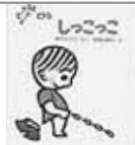
1歳から2歳ころ◀ 日常生活を 描いた 絵本