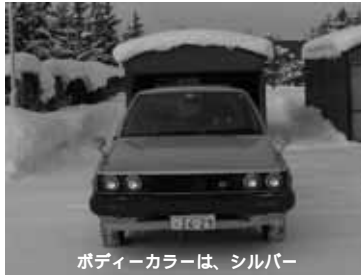
ポディーカラーは、シルバー

年式 昭和63年式 車種 トヨタカーリーナバンFF車 総排気量 1,480cc ガソリン車 走行距離 約63,000km 車検日 平成15年4月