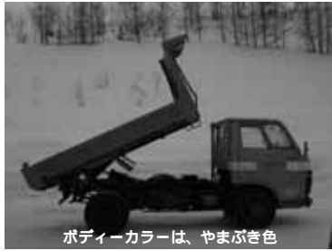
ポディーカラーは、やまぶき色

年式 昭和56年式 車種 トヨタダイナ2tダンプFR車 総排気量 2,970cc ディーゼル車 走行距離 約119,000km 車検日 平成15年3月