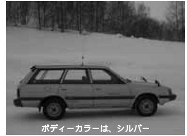
ポディーカラーは、シルバー

年式 平成元年式 車種 スバルレオーネバン4WD 総排気量 1,590cc ガソリン車 走行距離 約123,000km 車検日 平成15年5月