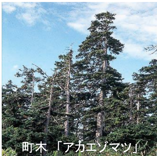
町木「アカエゾマツ」

発行日 令和6年4月 発行 北海道上富良野町議会 〒071-0596 空知郡上富良野町大町2丁目2番11号 (役場内 議会事務局) TEL 0167-45-6992 FAX 0167-45-5362 E-mail gikai@town.kamifurano.lg.jp URL http://www.town.kamifurano.hokkaido.jp