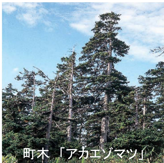
町木「アカエゾマツ」

発行日 令和4年4月 発行 北海道上富良野町議会 〒071-0596 空知郡上富良野町大町2丁目2番11号 (役場内 議会事務局) TEL 0167-45-6992 FAX 0167-45-5362 E-mail gikai@town.kamifurano.lg.jp URL http://www.town.kamifurano.hokkaido.jp