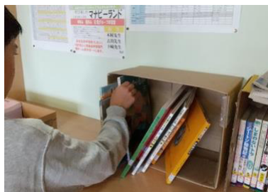
ボランティア団体の貸出用図書 (ふらの・ものがたり文化の会)

町内の学校、こども園、子どもセンター、図書館の担当職員が一同に集まる子ども読書推進会議では、各機関での読書推進活動の取組の報告や、情報交換などを行いました。また、各機関での読書環境の改善を図るため、毎年研修会を実施しており、壊れた本の修理の方法や学校図書館における配架の工夫などについて学びました。