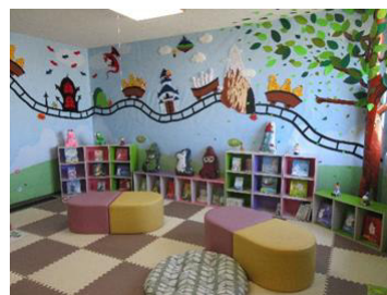
世界の童話館「ふれんどのもり」（図書館）