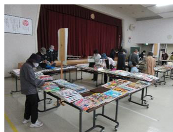
図書館まつりでの「本のリサイクル」（図書館）