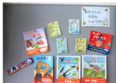
こども園の新刊コーナー (わかば中央保育園)