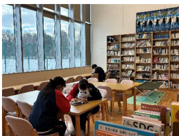
整備された学校図書館 (上富良野高校)