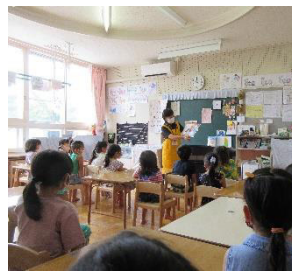
ボランティアによる読み聞かせ・朗読 (上富良野西小学校)