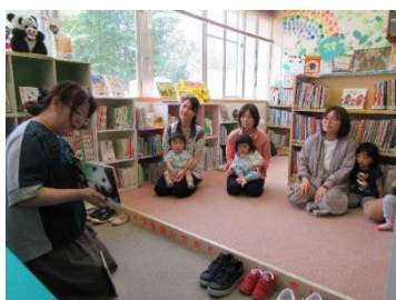
読みきかせ会（図書館）