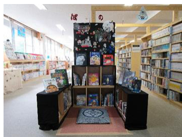
季節ごとの図書館内の装飾（図書館）