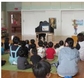
保育士による紙芝居 (わかば愛育園)

また、小中高校では、朝読書の時間を設け、「子どもたち自らが読書にふさわしい静かな環境を作り、集中して読書に励むことができている」「読書習慣が身に付き、学校図書館の利用が増えたり、本を購入したりする生徒が増えた」などの成果が見られました。また、各学校の委員会活動の中で様々な企画が実践されており、企画の取組期間中は利用者数や貸出冊数は向上したところですが、期間外も継続して利用してもらえるような工夫が必要であるとの課題も見えました。