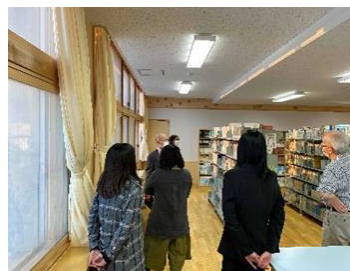
学校図書館（上富良野中学校）での研修会 (子ども読書推進会議)