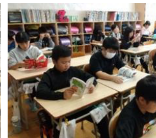
朝読書の様子 (上富良野小学校)