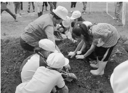
【上富良野小学校2学年 畑づくり】

また、学校の登下校時の見守り隊（住民会活動）も学校へのボランティア支援になっています。