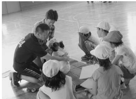
【西小学校 体力測定】