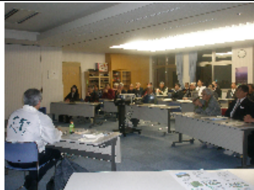
熱心に聞き入る参加者