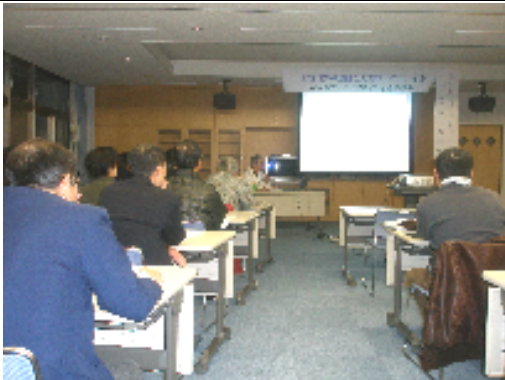
パワーポイントを使って説明