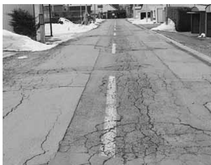
現在の東町4丁目3番通り