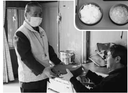
配食サービスボランティア