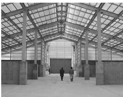
平成20年度畜産担い手育成総合整備事業による高度化処理施設(平成21年3月完成) 家畜(豚)のふんを堆肥にする施設

しかし、これは畜舎増設などの施設整備を行う国の「畜産担い手育成総合整備事業」の大幅減や「中の沢排水路整備事業」の完了が主な要因であり、それらを除くと実質的には、前年対比0・5%の増(3千700万円増)で、前年度とほぼ同額の予算規模となっており、