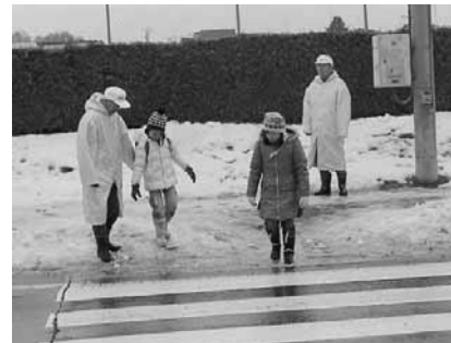
自治活動奨励事業補助による地域安全パトロール用防寒ロングコート(旭住民会)