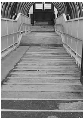
現在の人道跨線橋