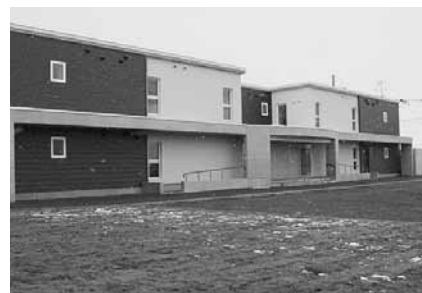
富町団地町営住宅(平成21年3月完成)

本年度は、自治基本条例の施行とあわせて、第5次上富良野町総合計画のスタートの年となります。「協働」を全町民のキーワードとして、「四季彩のまち・かみふらの」風土に映える暮らしのデザイン」の実現に向けて、各施策に取り組んでいきます。