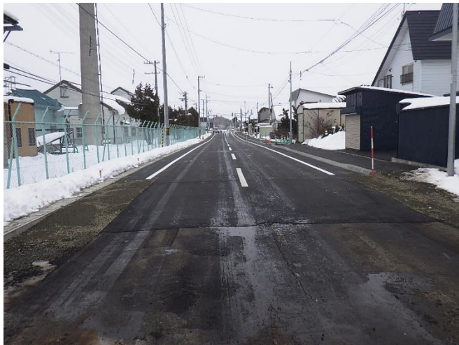
歩道設置・舗装改修