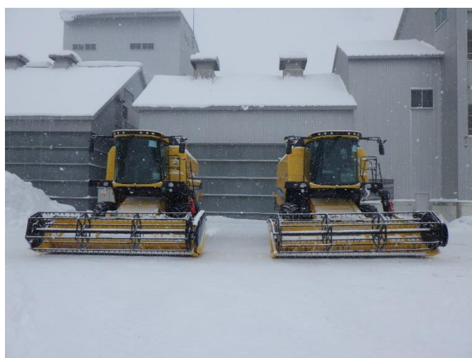
大型コンバイン2台