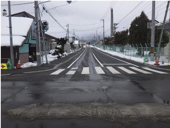
歩道設置・舗装改修